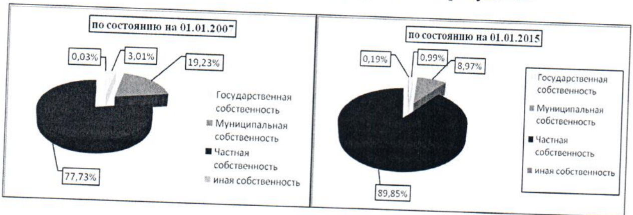
Рис. 2. Структура жилищного фонда в Пермском крае.

Структура жилищного фонда в Пермском крае в разрезе форм собственности (по состоянию на 01.01.2007 и на 01.01.2015) отображена на рисунке 2.