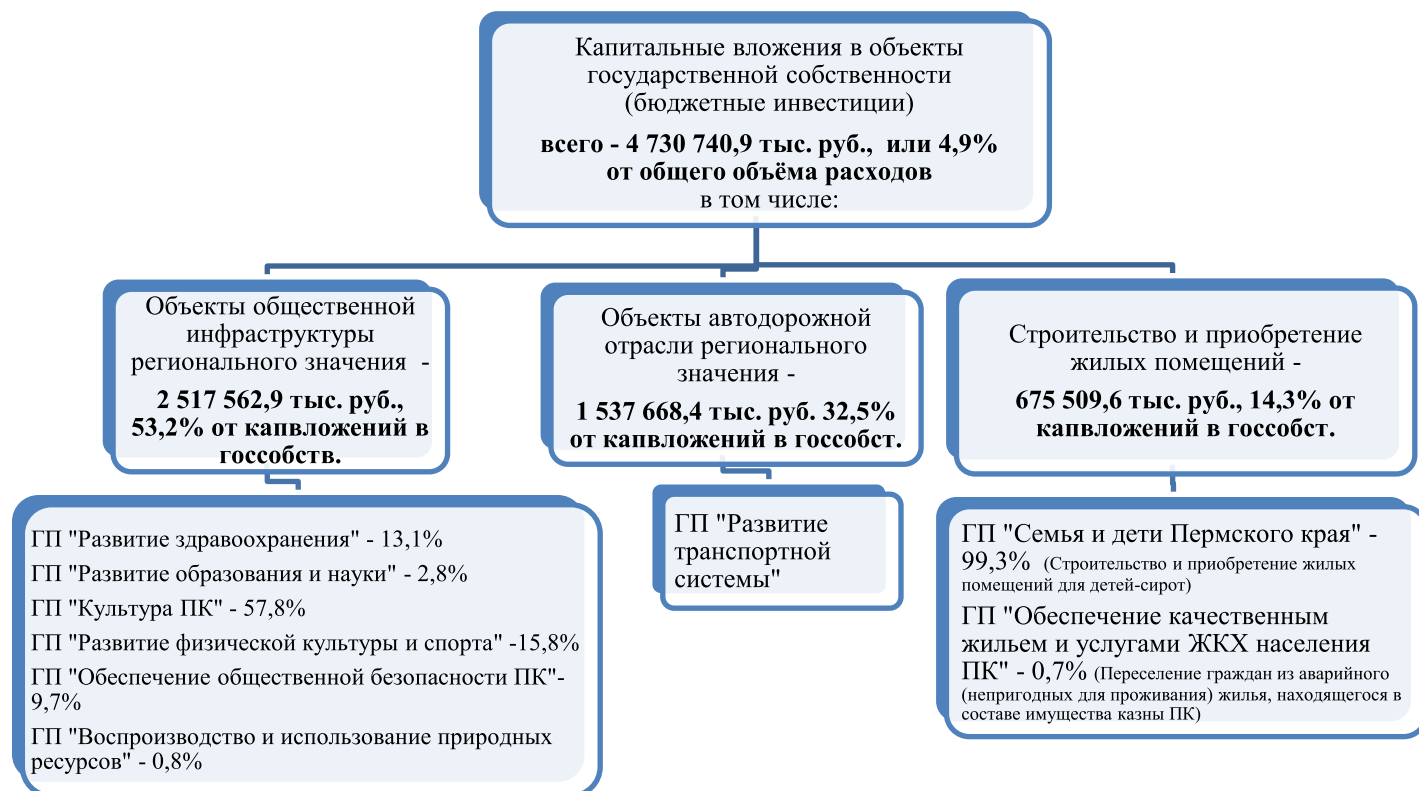
Рис.4. Общий анализ расходов предусмотренных в проекте бюджета на капитальные вложения в объекты государственной собственности Пермского края в 2016 году.

8.3. Общий анализ расходов, предусмотренных на капитальные вложения в законопроекте на 2016 год, - представлен на Рис.4.