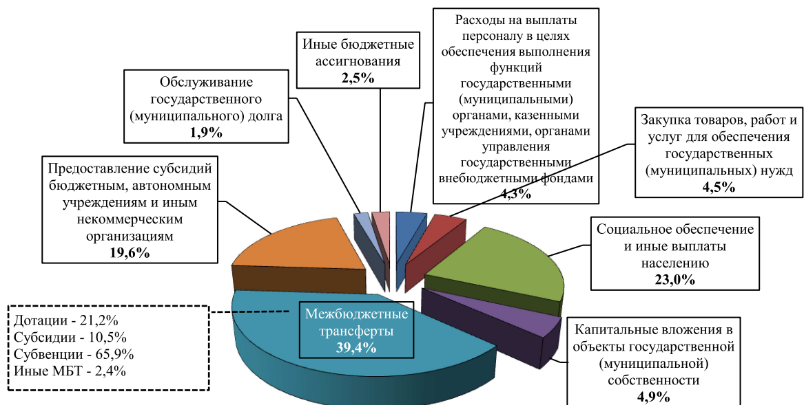
Рис.2. Удельный вес видов расходов планируемых в проекте бюджета на 2016 г., %.

5.1.2. В структуре финансирования бюджета по группам видов расходов наибольший удельный вес - 39,4% - приходится на межбюджетные трансферты, 23,0% - на социальное обеспечение и иные выплаты населению и 19,6% - на предоставление субсидий бюджетным, автономным учреждениям и иным некоммерческим организациям. Расходы краевого бюджета на осуществление бюджетных инвестиций составляют около 5% объёма расходов по госпрограммам.