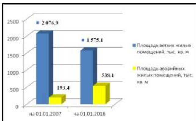
Рис. 1. Площадь ветхого и аварийного жилищного фонда.

Площадь ветхого жилья и аварийных жилых помещений отображена на рисунке 1.